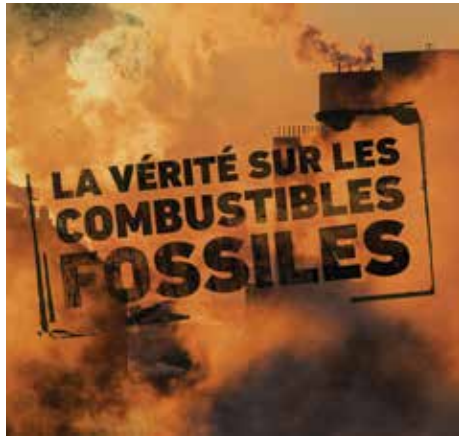
ILLUSTRATION : LINNY MALIN

Alors que ses propres scientifiques connaissaient les effets désastreux des émissions de gaz à effet de serre, l'industrie des combustibles fossiles a suivi la formule de l'industrie du tabac pendant des décennies : elle a menti à propos de la gravité des changements climatiques et des coûts associés à la réduction des émissions.