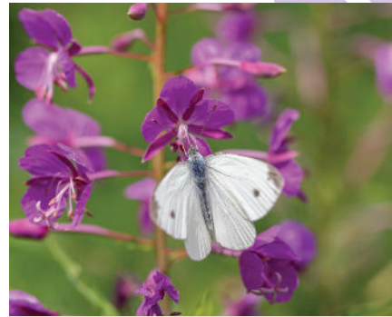
Épilobe à feuilles étroites