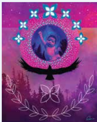
WACAK OTCI, UNE ILLUSTRATION DE ERUOMA AWASHISH

Les mesures équitables permettent de sauver des vies et de réduire les coûts des soins de santé, de prévenir les politiques publiques inefficaces et de mieux préparer, ensemble, notre avenir.