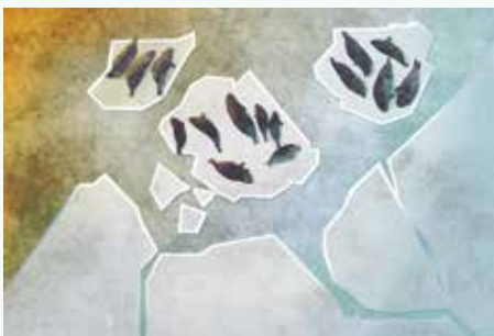
ILLUSTRATIONS DE CRYSTAL SMITH