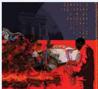
QUELLE EST LA COULEUR DU CHEVAL BLANC DE NAPOLEON?, UNE ILLUSTRATION DE NAFLERI