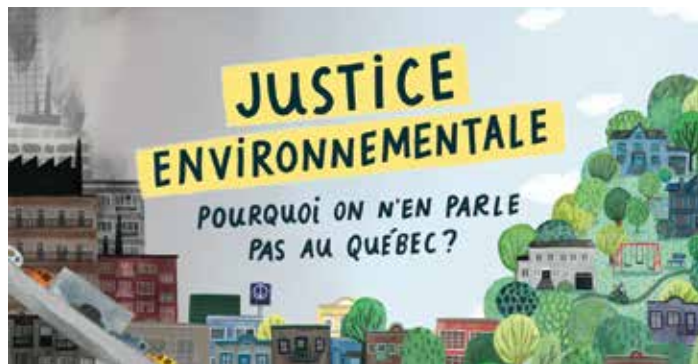
ILLUSTRATION DE CHLOÉ GERMAIN-THÉRIEN

Dans une série de récits personnels, des résident.e.s font part de leurs expériences quotidiennes, comme la façon dont les niveaux élevés de plomb dans le sol et les particules de poussière métallique issues des activités minières mettent en danger la santé des enfants, ou encore comment les collectivités se mobilisent pour apporter des changements.