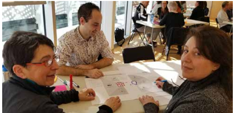
Les citoyen.ne.s de Laval en Transition s'unissent pour transformer positivement leur communauté.