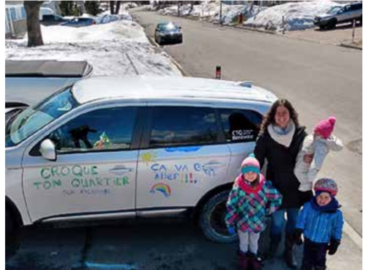
Marie-Claude Fontaine en compagnie d'Aurélié, d'Olivier et de Rosié

Par ses actions d'agriculture urbaine, les citoyen.ne.s de Croque Ton Quartier souhaitent tisser une vie de quartier à Québec en créant des espaces collectifs nourriciers. Ils n'ont pas fini de nous inspirer!