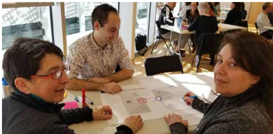
Les citoyen.ne.s de Laval en Transition s'unissent pour transformer positivement leur communauté.