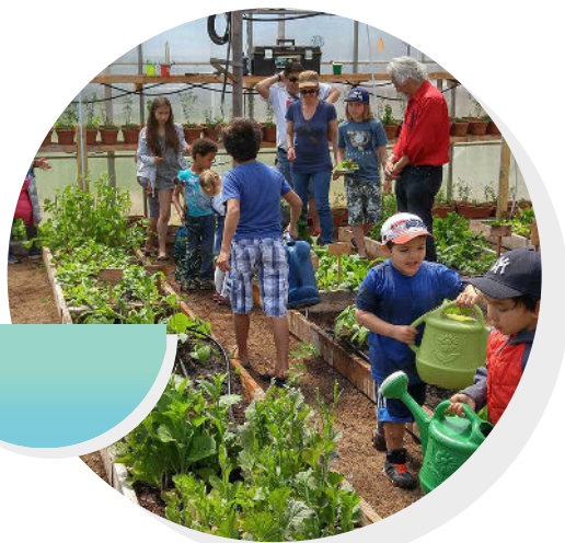
LE GRENIER BORÉAL, PRIX DU JURY EN 2016.