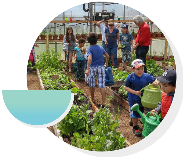
LE GRENIER BORÉAL, JURY PRIZE IN 2016