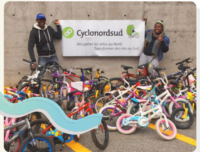
COMITÉ CYCLO NORD-SUD DE QUÉBEC, COUP DE CŒUR AWARD IN 2021

Got a question? Don't go it alone. Write us today at fondation@davidsuzuki.org ✨