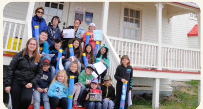
LES ALLIÉS DE LA MER, PRIX JEUNESSE EN 2021

Au sein de cette école de la Côte-Nord, tout le monde s'implique pour protéger l'environnement et plus particulièrement le fleuve Saint-Laurent. Au quotidien, cela se traduit par la récupération des déchets qui pourraient se retrouver dans les eaux du fleuve et le recyclage de plastiques sous toutes leurs formes. Une murale a ainsi été réalisée grâce aux milliers de bouchons recyclés et des bacs à marée ont été créés cette année, pour la journée mondiale de l'Océan, ce 8 juin. Placés au bord du fleuve, ceux-ci permettront de lutter contre la pollution marine en sensibilisant les vacancier.e.s et amoureux.ses du golfe à jeter et trier leurs déchets comme il se doit!