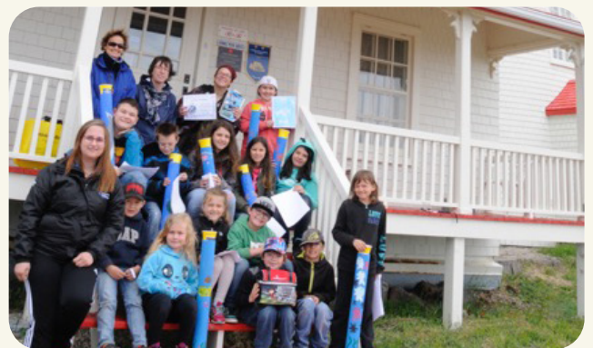
LES ALLIÉS DE LA MER, YOUTH PRIZE IN 2021

Everyone at the school is involved in protecting the environment, particularly the St. Lawrence River. On a daily basis, that means removing trash from the river and recycling all kinds of plastics. The students used the thousands of recycled bottle caps to create a mural and, this year, they built marine debris bins for World Oceans Day on June 8. Placed along the river's shore, the bins help fight ocean pollution by making vacationers and golf enthusiasts more aware of the issue and encouraging them to sort their waste properly.