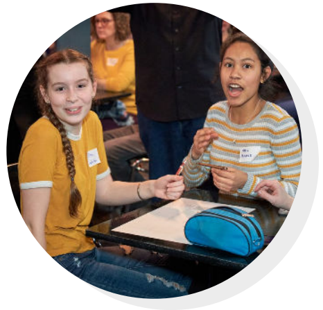
PROJET LAC OSISKO, JURY PRIZE IN 2021