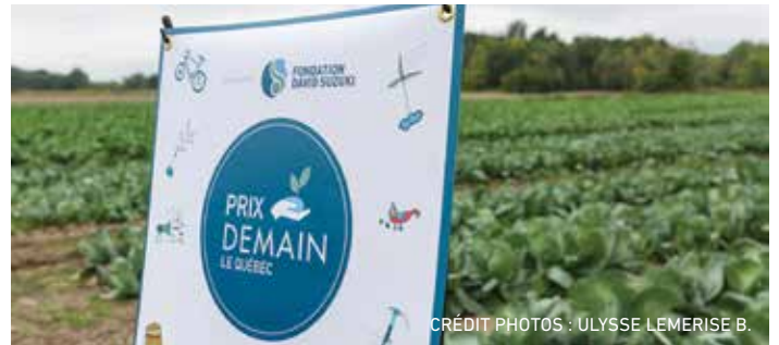
La cérémonie de remise du prix à Regroupement Partage, pour son programme Cultiver l'Espoir et le lancement du Prix Demain 2018, en compagnie de David Suzuki.

« Voilà un antidote infallible contre le cynisme, une invitation à penser le monde autrement et à agir en conséquence ! » A DÉCLARÉ AVEC ENTHOUSIASME DAVID SUZUKI