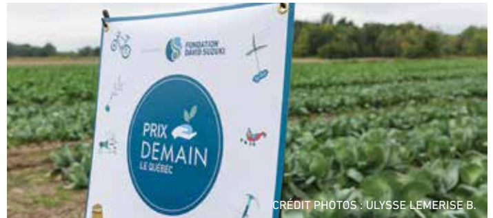
La cérémonie de remise du prix à Regroupement Partage, pour son programme Cultiver l'Espoir et le lancement du Prix Demain 2018, en compagnie de David Suzuki.

« Voilà un antidote infallible contre le cynisme, une invitation à penser le monde autrement et à agir en conséquence ! » A DÉCLARÉ AVEC ENTHOUSIASME DAVID SUZUKI